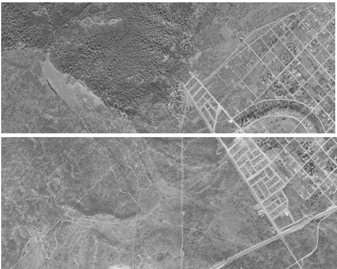
FIGURA 1 – VISTA DE LAS ESTRIBACIONES DEL C° OTTO Y LA DESCARGA DE UNA CUENCA QUE CONTINUA EN UNA VAGUADA QUE SE DIRIGE HACIA EL B° 34 HAS. (B° UNIÓN Y 2 DE ABRIL)

En la actualidad esa vaguada sólo transporta caudales aportados en forma directa por el C° Otto, desde el cono aluvial mencionado hacia el este, incluyendo los que descienden de una ladera incendiada, que es un riesgo potencial importante por la lenta regeneración de la cobertura protectora vegetal. El agua de esta vaguada ingresa a la zona de "34 hectáreas" por una alcantarilla de escasas dimensiones cruzando la calle límite Sur (Crucero Gral. Belgrano) y luego continúa por canalización precaria entre las viviendas allí existentes. Esta condición de escurrimiento es muy precaria ya que el canal se ubica entre viviendas muy modestas con terrenos muy pequeños y las consecuencias de los desbordes son muy graves para sus habitantes. Esta situación es de alto riesgo y de precarización de las condiciones de vida de los habitantes expuestos a las inundaciones.