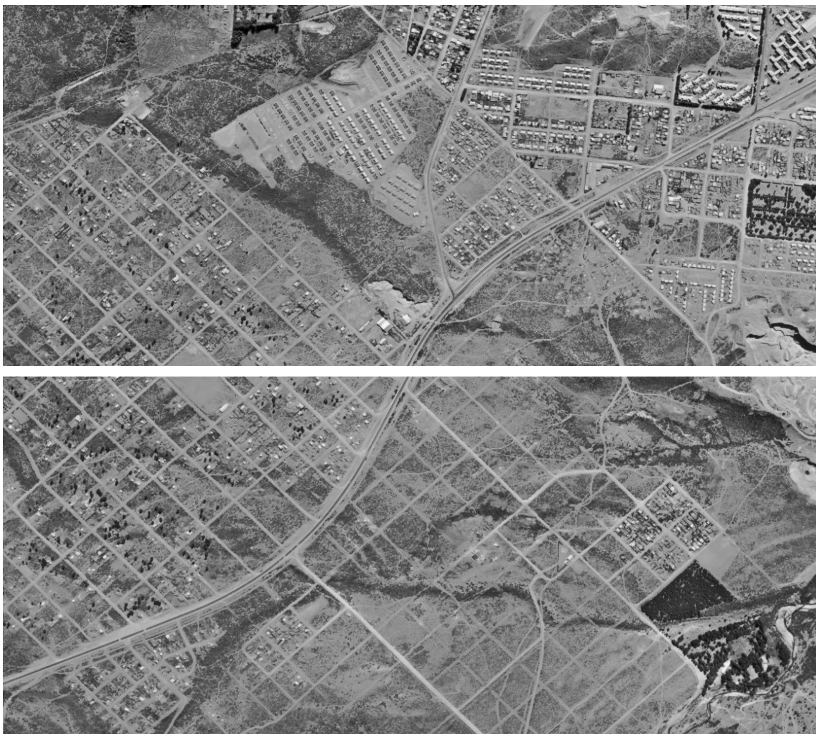
FIGURA.2 – SALIDA DE AGUAS PLUVIALES DE B° EL FRUTILLAR CRUZANDO LA RN 258 Y DESCARGANDO SOBRE EL B° NUESTRAS

El cuerpo receptor de las aguas pluviales de la Pampa de Huenuleu es el cauce del A°Ñireco, de suficiente amplitud y capacidad para recibir los caudales, por lo que no constituye en principio un limitante o restricción del problema.