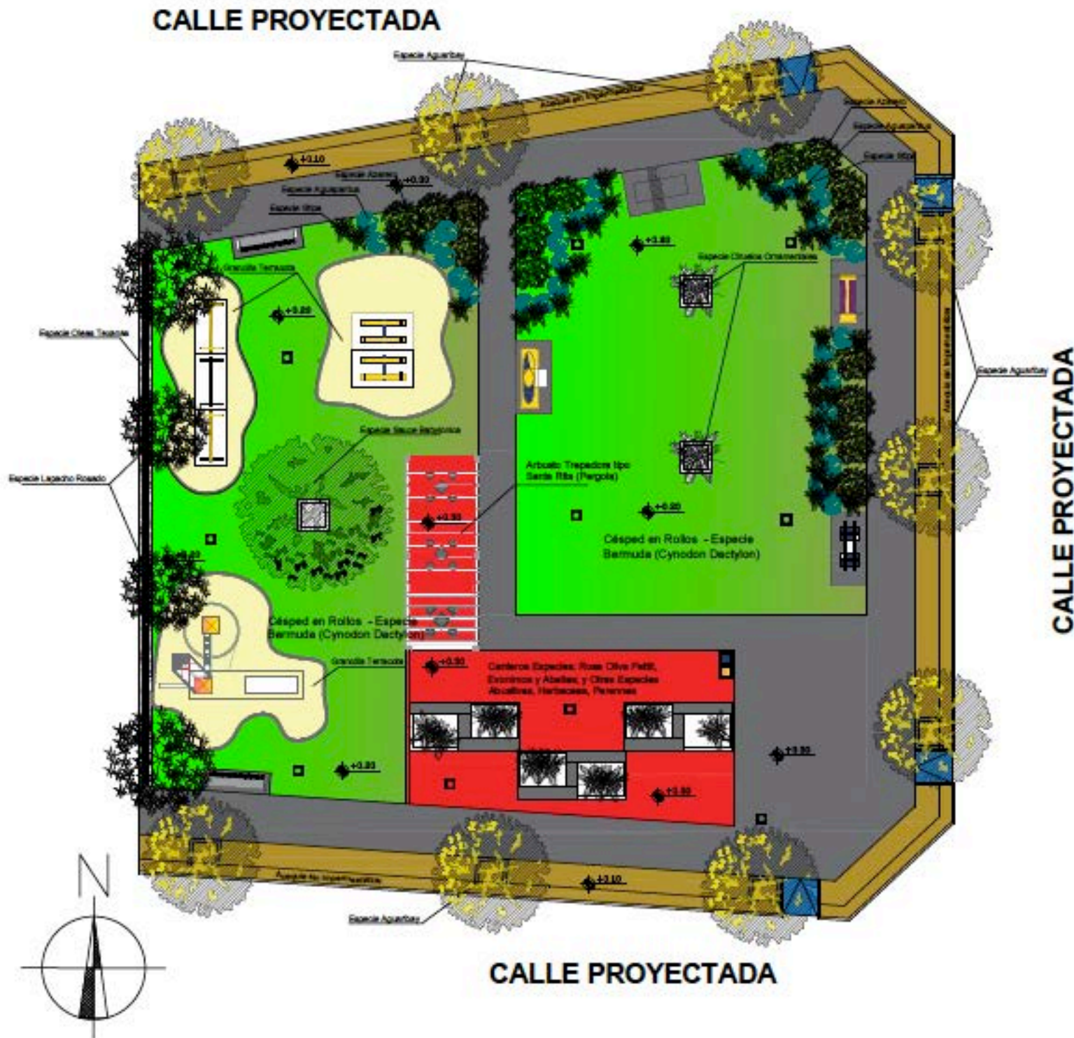
PLANTA DE PARQUIZACIÓN - Esc: 1:100