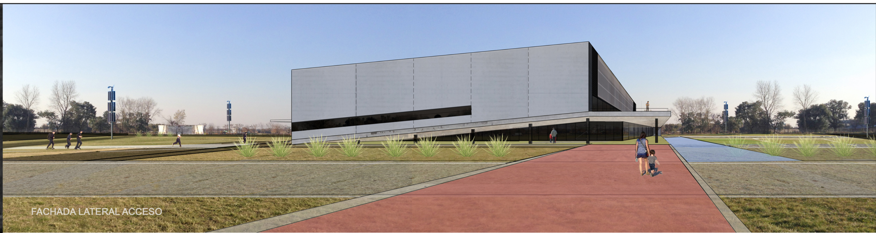
FACHADA LATERAL ACCESO

CANCHAS ILUMINACION GENERAL SENDERO INTERIORES